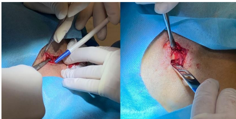
Figura 5: Incisão extra-oral em ângulo de mandíbula (risdon);

A dissecação continuou até que o único tecido remanescente na borda inferior da mandíbula foi o perióstio. Foi utilizada a peça reta com broca esférica número 6 e peça reta 702 para osteotomia do osso na base da mandíbula com irrigação de solução salina estéril a todo momento para não ter necrose óssea (figura 6).