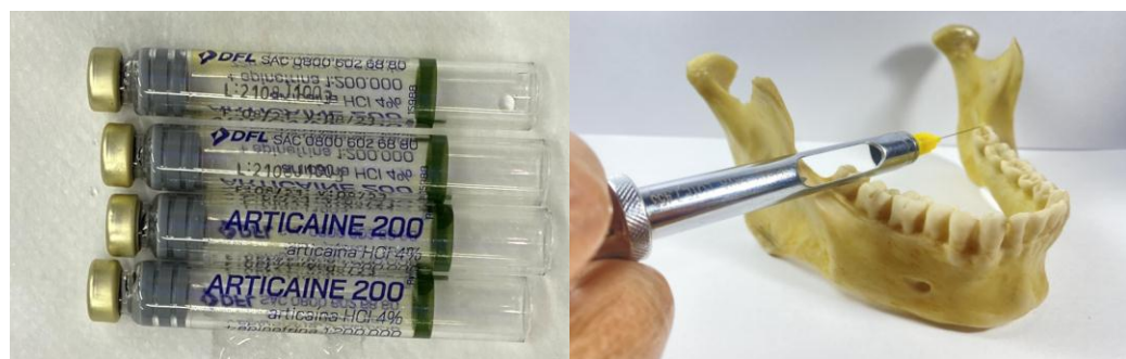
Figura 4: tubetes de articaína e técnica anestésica

Foram utilizados quatro tubetes de articaína 4% com epinefrina de 1:100.000 (Figura 4).