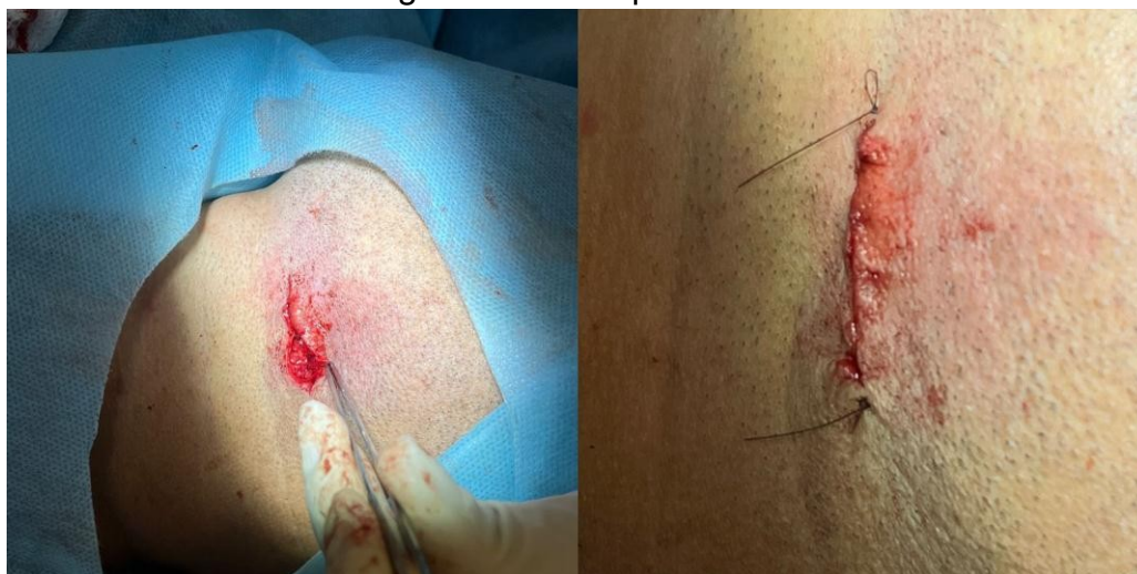
Figura 8: Sutura por Planos.

A sutura foi feita por planos com vicril 4-0 em pontos simples internos. Os músculos masseter e pterigoide medial foram suturados juntos com as suturas reabsorvíveis. A sutura externa foi feita com nylon 5-0, com ponto intradérmico para melhor cicatrização e estética (figura 8).