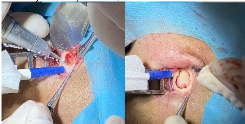
Figura 6: Dissecação até o perióstio; Osteotomia com broca esférica nº 6