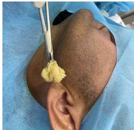
Figura 3: degermação extra oral com clorexidina 2%, na base da mandíbula

Em ambiente ambulatorial, foi feita a antisepsia intra oral com solução de clorexidina 0,12%. A cirurgia foi iniciada com a degermação e antisepsia das unhas, mãos e antebraços com solução de PVPI a 10%, paramentação e montagem do campo cirúrgico. Após isso, foi realizada a antisepsia extrabucal com solução de clorexidina 2% na região de base da mandíbula e pescoço. Com o auxílio de uma seringa Carpule foi feita a continuação do procedimento com a administração das anestésias locais (figura 3).