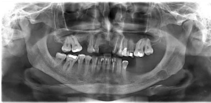
Figura 10: Radiografia panorâmica final.

Após 3 meses, foi solicitada uma panorâmica final. Não foi relatado parestesia, sem alteração no local cirúrgico e uma boa cicatrização óssea e tecidual. (figura 10).