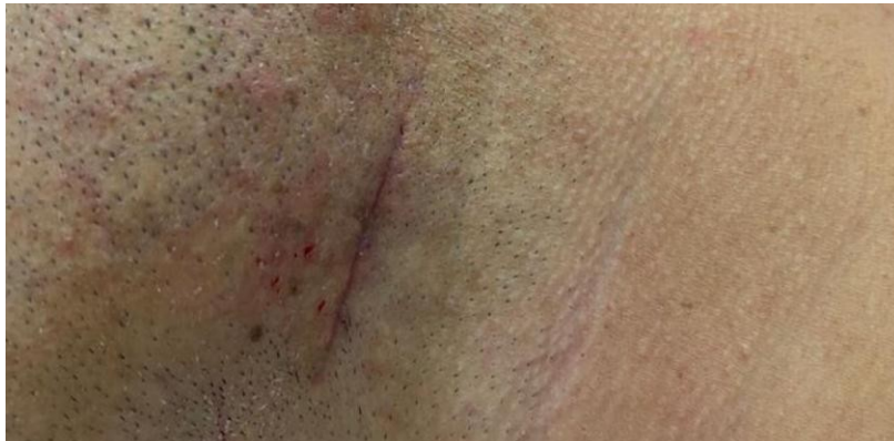
Figura 9 – aspecto clínico do local cirúrgico.

realizada a retirada de pontos extraoral, sem queixas de desconforto, sem edema e parestesia. O tecido extraoral onde foi realizada a incisão, apresentava uma excelente condição cicatricial, sem sinal de inflamação ou infecção (figura 9).