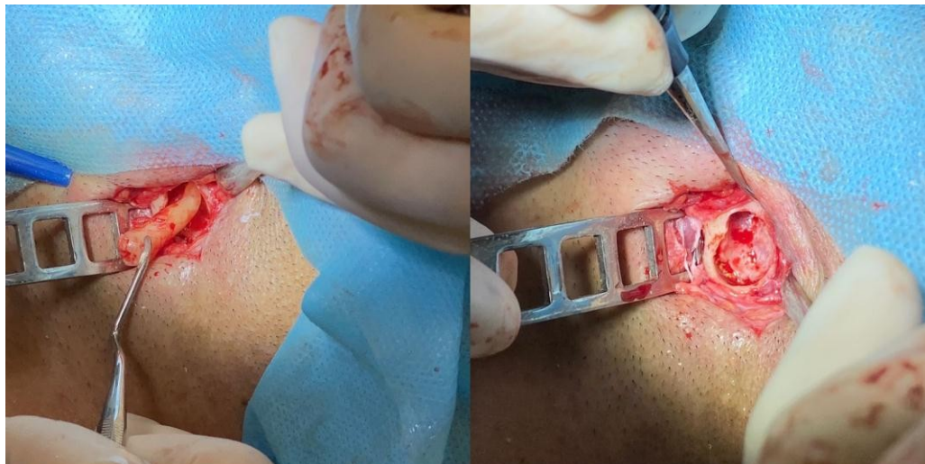
Figura 7: Luxação com alavanca angulada; Curetagem.

Realizou-se a extração do dente 35, a partir de luxação com alavanca Seldin reta e angulada, com movimentos de cunha e rotação, exérese do elemento inteiro (não foi necessário realizar odontosecção), curetagem da região para que não haja espícula óssea e tenha uma inflamação tecidual e irrigação abundante com solução salina estéril para lavagem (figura 7).