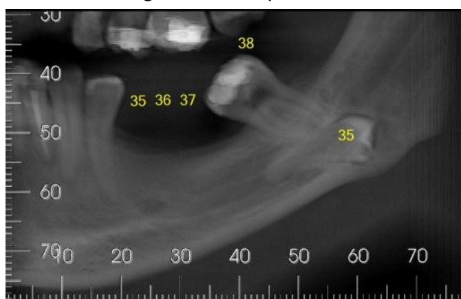
Figura 1: vista panorâmica

Na vista panorâmica (figura 1) notou-se a ausência dos dentes 36 e 37 e o 35 presente na base da mandíbula, em posição ectópica. Na tomografia de feixe cônico (Figura 2) notamos um íntimo contato com a raiz do 38 (cortes 51.0 E 75,1TC).