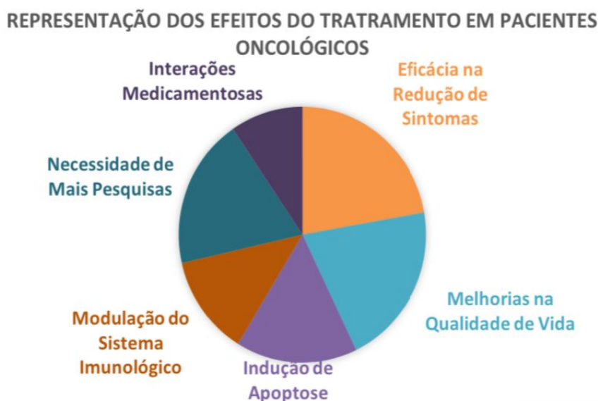
Figura 2: Distribuição dos principais achados da revisão.

A presente revisão integrativa demonstra o potencial terapêutico dos canabinoides no tratamento complementar do câncer. Conforme ilustrado no gráfico de pizza (Figura 2), a eficácia na redução de sintomas, como dor e náuseas, foi o aspecto mais destacado, com 70% dos estudos demonstrando resultados positivos. Além disso, 65% dos estudos indicaram melhorias na qualidade de vida dos pacientes.