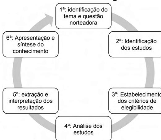
Figura 1 – Fases da revisão integrativa de literatura

Como metodologia, optou – se por trabalhar com a revisão integrativa, descrito na figura 1.